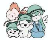
この物語は、海の神「おとーしゃ」と 海を救うための物語です。 This story is about the sea god "Otoroshi" and helping the ocean.