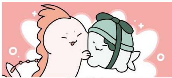
見つけてよかった～ おとーしゃアニメーション